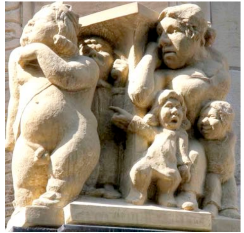
ILL. FASSADENSKULPTUREN IN KÖLN

in den Spiegel, dann schritt er erhobenen Hauptes zum Baldachin, während die beiden Schleppenträger ins Leere fassten, um die Schleppe aufzunehmen. Unter dem prächtigen Thronhimmel schritt nun der nackte Kaiser der Prozession voran durch die Gassen, die von Tausenden von Leuten, von Groß und Klein, von Jung und Alt, von Arm und Reich gesäumt waren. Das Volk jubelte seinem Herrscher zu, niemand wollte zugeben, dass der Kaiser nackt war. Man lobte die ausgewählte Farbe der Beinkleider, den eleganten Zuschnitt des Mantels und das edle Muster der Schleppe. „Herrlich!“ - „Entzückend“ - „Attraktiv!“ - „Umwerfend!“ - „Einfach schön!“ - So tönte es überall, und in einer kurzen Pause, als die Leute nach weiteren lobenden Worten suchten, hörte man die Stimme eines kleinen Kindes: „Der hat ja nichts an!“ Die Umstehenden fragten den Vater: „Was hat das Kind gesagt?“ Der Vater wiederholte laut und deutlich: „Der hat ja nichts an!“ Darauf wiederholten die Umstehenden: „Der hat ja nichts an!“ Und der Ruf ging weiter, Gasse auf, Gasse ab und immer lauter: „Der hat ja nichts an!“ Der hundertfache Ruf brauste dem Kaiser um die Ohren, doch er dachte: „Ich muss diese Prozession durchstehen.“ Die Schleppenträger gingen noch aufrechter und hielten die Schleppe noch fester, obwohl die gar nicht existierte.