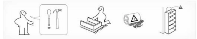
Moderne Kompetenzen : Montageanleitung eines schwedischen Möbelhauses verstehen.

Büchern geradezu greifbar. Die Statistik hat herausgefunden, dass heutzutage mehr Bücher denn je gekauft werden. Werden sie aber auch gelesen? Die Konkurrenz aus leichter konsumierbaren Medien wie Film, Fernsehen und Internet ist groß. Bedenken, dass das Buch durch die elektronischen Medien verdrängt würde, sind unbegründet.