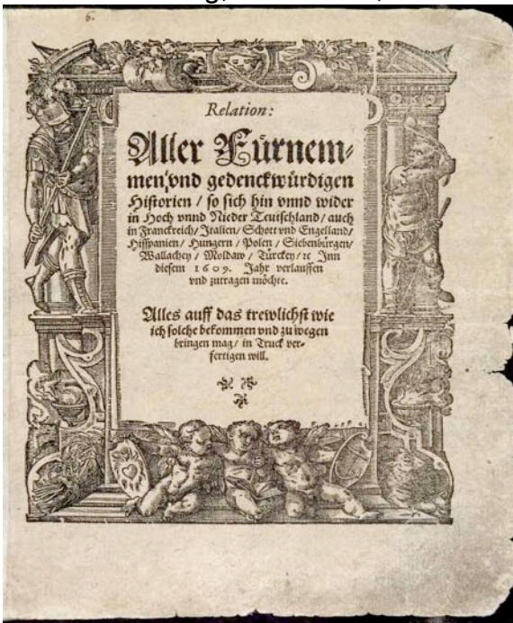
Die älteste Zeitung , die „Relation“ (Straßburg, 1609)

Zwar blieb bei den Bauern das Lesen noch längere Zeit auf die Lektüre der Bibel beschränkt. In bürgerlichen Kreisen aber verbreiteten sich seit der Renaissance sowohl wissenschaftliche Erkenntnisse, politische Ereignisse und gesellschaftliche Modeerscheinungen schnell über ganz Europa. Zeitungen im heutigen Sinn gab es zwar erst gegen Ende des 18. Jahrhunderts, doch wurden bereits zur Zeit des Dreißigjährigen Krieges (1618 bis 48) Neuigkeiten als Flugblätter gestaltet, auf den Marktplätzen der Städte für ein paar Pfennige angeboten, oft von Bänkelsängern. Auf dem Land verbreiteten Kolportiere (Hausierer mit Bauchladen) solche Flugblätter mit den Neuigkeiten. Dass in Europa fast alle erwachsenen Menschen lesen und schreiben können, das gibt es erst etwa seit 150 Jahren. Nach den Bürgerrevolutionen von 1848 zogen sich die Könige und Fürsten mehr und mehr zurück, und in Republiken, vor allem in den Demokratien, war der mündige und informierte Bürger wichtig geworden. Mit der Industrialisierung, die damals, in der Mitte des 19. Jahrhunderts, so richtig einsetzte, wurden