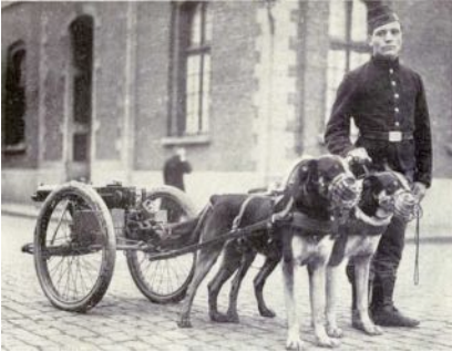
Belgischer Mitrailleur 1914

Aber die schlimmen Nachrichten häuften sich und wurden immer bedrohlicher. Erst das Ultimatum Österreichs an Serbien, die ausweichende Antwort darauf, Telegramme zwischen den Monarchen und schließlich die kaum mehr verborgenen Mobilisationen. Es hielt mich nicht mehr länger in dem engen, abgelegenen Ort. Ich fuhr jeden Tag mit der kleinen elektrischen Bahn nach Ostende hinüber, um den Nachrichten näher zu sein; und sie wurden immer schlimmer. Noch badeten die Leute, noch waren die Hotels voll, noch drängten sich auf der Digue promenierende, lachende, schwatzende Sommergäste. Aber zum ersten Mal schob sich etwas Neues dazwischen. Plötzlich sah man belgische Soldaten auftauchen, die sonst nie den Strand betraten. Maschinengewehre wurden – eine sonderbare Eigenheit der belgischen Armee – von Hunden auf kleinen Wagen gezogen.