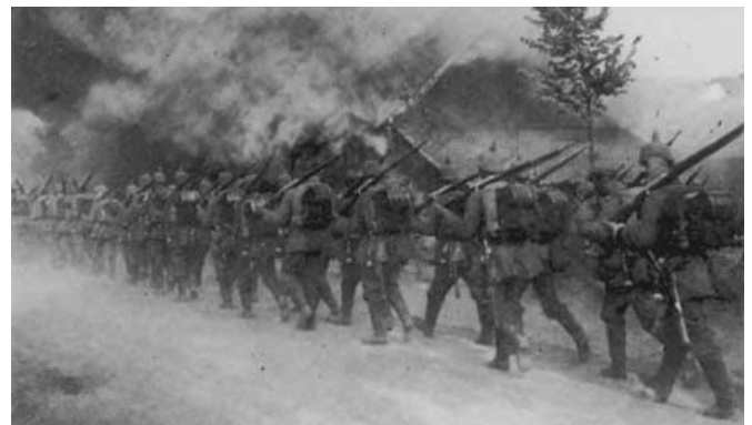
Deutsche Infanterie auf dem Vormarsch durch Belgien im August 1914