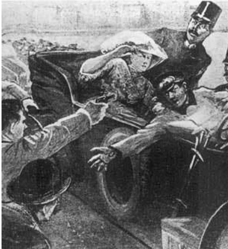
Das Attentat von Sarajewo vom 28. Juli 1914

Erbitterung war von den Gesichtern abzulesen. Denn der Thronfolger war keineswegs beliebt gewesen. Noch von meiner frühesten Kindheit erinnere ich mich an jenen andern Tag, als Kronprinz Rudolf, der einzige Sohn des Kaisers, in Mayerling erschossen aufgefunden wurde. Damals war die ganze Stadt in