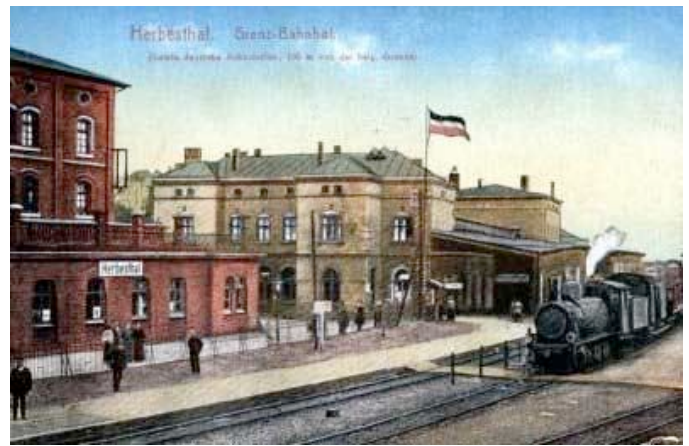
Der Grenzort Herbesthal um 1914

Erkundigungen einzuziehen. Aber der Bahnhof war besetzt von Militär. Als ich in den Wartesaal eintreten wollte, stand vor der verschlossenen Tür abwehrend ein Beamter, weißbärtig und streng: niemand dürfe die Bahnhofsräume betreten. Aber ich hatte schon hinter den sorgfältig verhängten Glasscheiben der Tür das leise Klirren und Klinkern von Säbeln, das harte Niederstellen von Kolben gehört. Kein Zweifel, das Ungeheuerliche war im Gang, der deutsche Einbruch in Belgien wider aller Satzung des Völkerrechts. Schauernd stieg ich wieder in den Zug und fuhr weiter, nach Österreich zurück. Jetzt gab es keinen Zweifel mehr: ich fuhr in den Krieg.