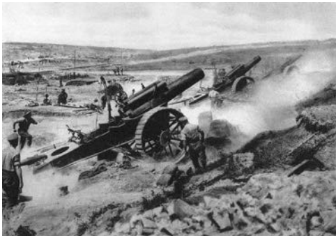
Deutsche Artillerie beschießt ein belgisches Fort im August 1914

Aber auf dem halben Wege nach Herbesthal, der ersten deutschen Station, blieb plötzlich der Zug auf freiem Felde stehen. Wir drängten in den Gängen zu den Fenstern.