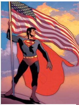
In den Nullerjahren, zu Zeiten von 9/11

Das Ende des Kriegs raubte den Superhelden die Daseinsberechtigung, die meisten verschwanden so plötzlich, wie sie aufgetaucht waren – bis auf die Dauerbrenner Batman, Wonderwoman und Superman. Diese mussten sich nun neu orientieren. Und so schlug sich Superman fortan mit Verbrechergenies herum, mit außerirdischen Bedrohungen, Robotern und anderen Schuftten. Dabei wurde der ebenso geniale wie großwahnstinnige Lex Luthor zu seinem Erzfeind. In den sechziger Jahren wurde Superman zur Comicfigur für Kinder