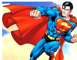
Superman zu Zeiten von Donald Trump

Um die Figur von Superman wurde schon lange keine relevante Geschichte mehr erzählt, und schon lange hat er dem Genre keine Impulse mehr geben können. Superman ist ein Logo, und das schränkt seinen psychologischen und erzählerischen Spielraum ein – ganz im Gegensatz zu Batman und gewissen Heroen der sechziger Jahre wie Spiderman oder die X-Men, die zwar weniger Symbolkraft haben, aber interessantere und entwicklungsfähige Figuren abgeben.