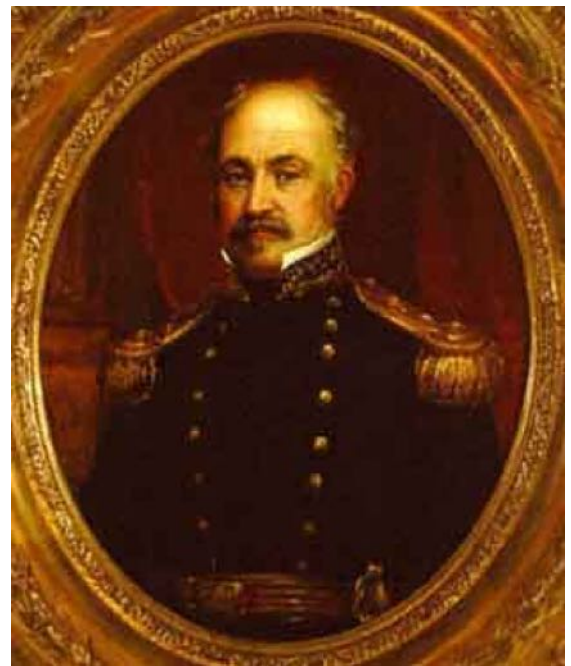
John A. Sutter um 1860

Und nun tritt Johann August Sutter plötzlich vor mit seinen Ansprüchen. Der ganze Boden, so heischt er, auf dem die Stadt San Francisco gebaut ist, gehört ihm nach Fug und Recht. Der Staat ist verpflichtet, den Schaden, den er durch Diebstahl seines Eigentums erlitten, gutzumachen, an allem aus seiner Erde geförderten Gold beansprucht er sein Teil. Ein Prozess beginnt in Dimensionen, wie sie die Menschheit vor ihm nie gekannt. Sutter verklagt siebzehntausendzweihunderteinundzwanzig Farmer, die sich in seinen Pflanzungen angesiedelt haben, und fordert sie auf, den