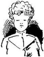
Försters Fritze, blond und kraus, ja, der sieht schon besser aus.