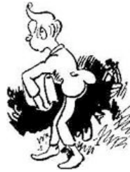
Ferdinandchen Mickefett scheint ihr nicht besonders nett.