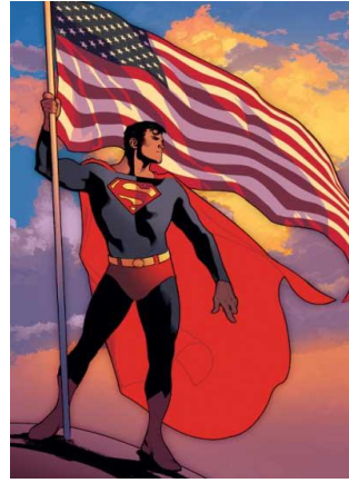
Heute, nach 70 Jahren

mehr geben können. Superman ist ein Logo, und das schränkt seinen psychologischen und erzählerischen Spielraum ein – ganz im Gegensatz zu Batman und gewissen Heroen der sechziger Jahre wie Spiderman oder die X-Men, die zwar weniger Symbolkraft haben, aber interessantere und entwicklungsfähige Figuren abgeben.