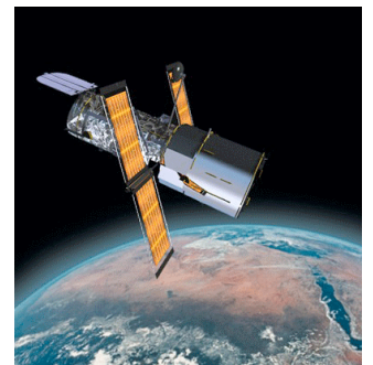
Hubble: Trouve-t-on une vie extraterrestre?

des centaines: Hunderte von... les jumelles: der Feldstecher la surface: die Oberfläche le lieu: der Ort loin, lointaine: ferne