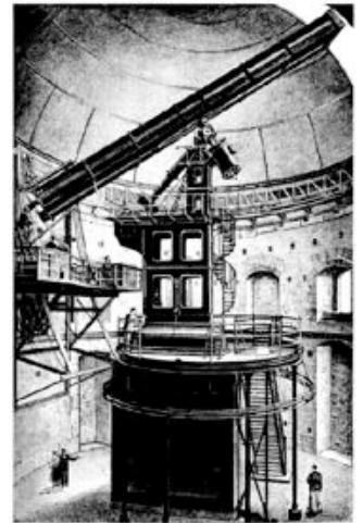
L'observatoire de Meudon (en 1898)

L'étude de cette planète a montré la présence de dioxyde de carbone dans l'atmosphère, ce qui fait possible une vie. La température de l'air est entre -10 et 40° Celsius. Les astronomes ont vu un signal lumineux non naturel sur cette planète. Est-ce la preuve qu'il existe une vie intelligente sur cette planète lointaine?