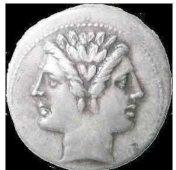
Münze mit dem römischen Gott Janus, der nach vorne und zurück blickt und der dem Monat Januar den Namen gegeben hat.