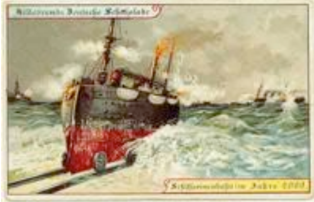
In hundert Jahren werden wir mit Schiffseisenbahnen reisen.

Um das Jahr 1900 legten die Schokoladenfabrikanten ihren Produkten Postkarten bei mit Vorstellungen darüber, wie die Welt im Jahr 2000 aussehen werde. Einiges traf ein, vielleicht in etwas anderer Form.