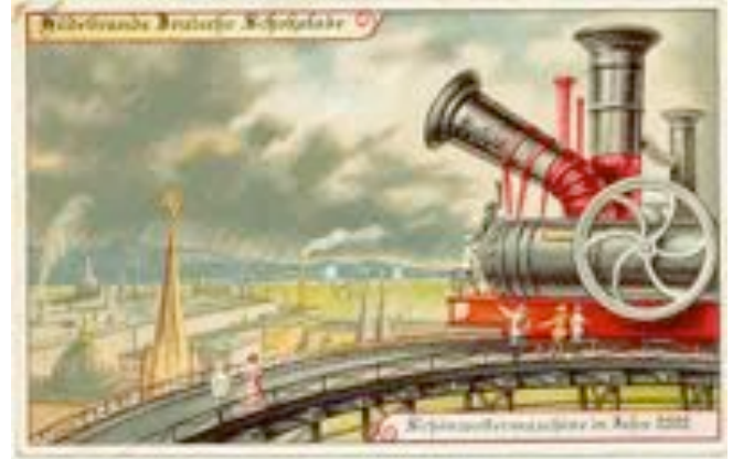
In hundert Jahren wird es Schönwettermaschinen geben.