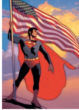
Heute, nach 70 Jahren

schon lange hat er dem Genre keine Impulse mehr geben können. Superman ist ein Logo, und das schränkt seinen psychologischen und erzählerischen Spielraum ein – ganz im Gegensatz zu Batman und gewissen Heroen der sechziger Jahre wie Spiderman oder die X-Men, die zwar weniger Symbolkraft haben, aber interessantere und entwicklungsfähige Figuren abgeben.