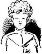
Försters Fritze, blond und kraus, ja, der sieht schon besser aus.