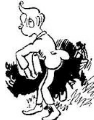
Ferdinandchen Mickefett scheint ihr nicht besonders nett.