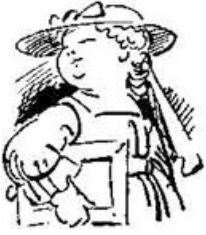
Und mit teilnahmevollem Sinn schaut sie gern nach Knaben hin.