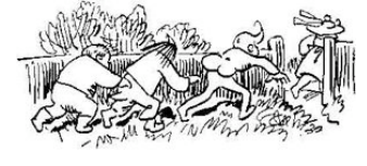
Kränkend ist ein solches Wort. Julchen eilt geschwinde fort.

Böse Knaben gibt's noch viele, zeichne zwei nach deinem Stile!