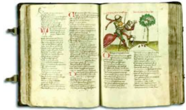
Die Berner Parzival-Handschrift

Parzival stieg ab, er führte sein Ross sorglos an den Mannen vorbei und pochte an. Ein Pförtner fragte nach seinem Begehrt. Er möge der Königin melden, sagte Parzival, ihr Freund und Befreier sei gekommen. Da tat man erstaunt das Tor auf. Als der Reiter aber durch die Stadt trabte, wurde er traurig, so müde stapften die Bürger in ihren Rüstungen dahin; Frauen und Kindern blickte der Hunger aus den Augen.