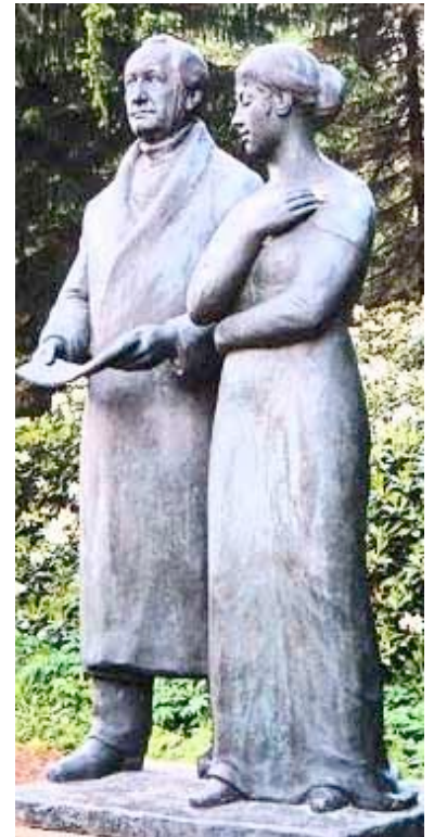
Goethe-Denkmal in Marienbad (heute Tschechien)

Auch noch im Alter ergriff Goethe immer wieder die Leidenschaft für schöne und geistvolle Frauen . Aus seiner Beziehung zu Marianne von Willemer entstand der „West-Östliche Diwan“, als Zweiundsiebzigjähriger verliebte er sich bei einem Kuraufenthalt in Marienbad in die neunzehnjährige Ulrike von Levetzow - den Schmerz über die Abweisung des Heiratsantrags drückte Goethe in seiner „ Marienbader Elegie “ aus, mit deren Niederschrift er im September 1823 auf seiner Abreise aus Marienbad in der Kutsche begann. Bis ins höchste Alter – er starb 1832 im Alter von fast 83 Jahren – war Goethe von einer erstaunlichen Schaffenskraft . Seine Lebenserinnerungen schrieb er auf in seinem Werk „ Dichtung und Wahrheit “.