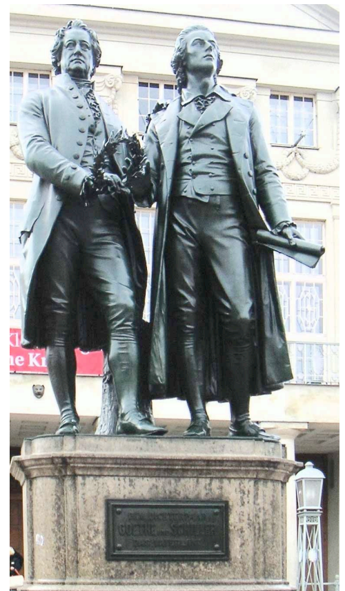
Goethe und Schiller, Denkmal in Weimar

Goethe wurde immer berühmter . Menschen aus vielen Ländern pilgerten nach Weimar, um ihm ihre Verehrung zu zollen. Goethe zog sich mehr und mehr aus der Öffentlichkeit zurück. Er baute sich seine eigene Welt der Schönheit und der idealen Formen auf und beschäftigte sich mit Naturforschungen.