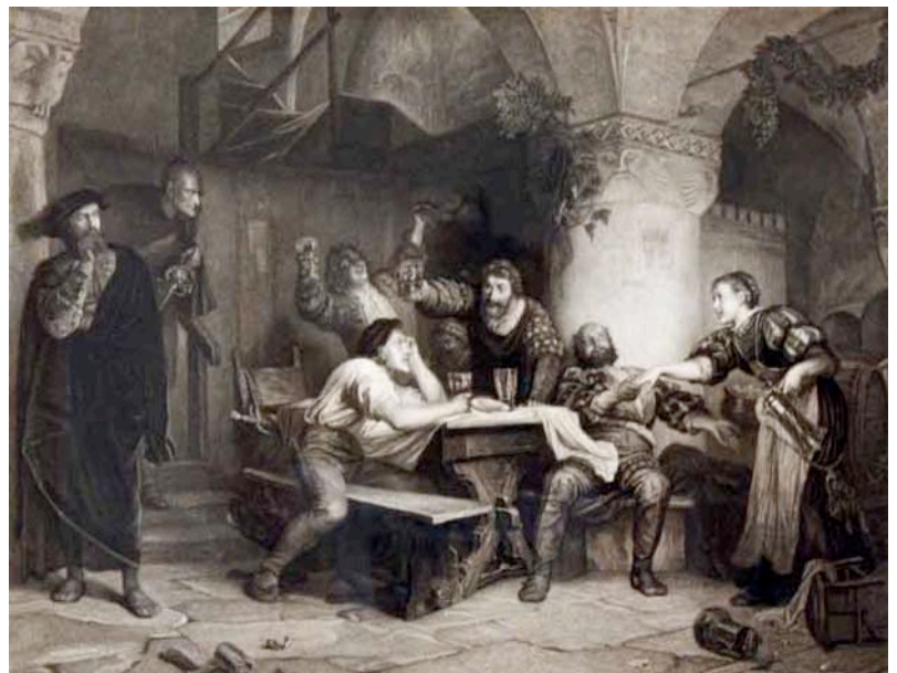
In Auerbachs Keller, Leipzig. (Szene aus dem „Faust“)

Der junge Goethe lernte auch Klavier spielen, fechten und reiten. Mit 16 Jahren zog er nach Leipzig, um, dem Wunsch seines Vaters folgend, Rechtswissenschaft zu studieren. Eigentlich hätte er lieber in Göttingen alte Sprachen, Geschichte und Literatur studiert. Öfters als in rechtswissenschaftlichen Vorlesungen zu sitzen, genoss er dann das Studentenleben: „Mein Leipzig lob ich mir! Es ist ein Klein-Paris und bildet seine Leute“ wird später in seinem Werk „Faust“ zu lesen sein. In Leipzig stieß der junge Goethe auf die Motive für den Faust-Stoff. Er setzte mit seiner Dichtung auch dem „Auerbachs Keller“ - einer Lokalität, in der er gern zechte - ein Denkmal.