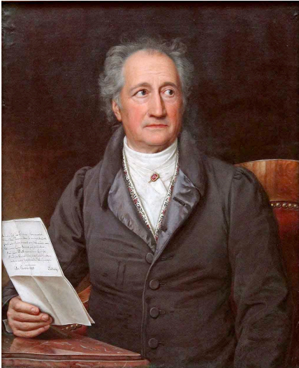
Johann Wolfgang von Goethe um 1828

Um 1770 entsteht in Deutschland mit dem „Sturm und Drang“ eine Bewegung junger Schriftsteller, die sich als Gegenpol zur vernunft- und verstandesbetonten Aufklärung versteht. Diese neuen Literaten stellen das Gefühl und die grenzenlose Selbstentfaltung des Einzelnen in den Mittelpunkt. Die wichtigsten Vertreter dieser kurz dauernden Bewegung sind Johann Wolfgang Goethe und Friedrich Schiller. Mit ihren frühen Dramen wie Goethes „Götz von Berlichingen“ und Schillers „Die Räuber“ und „Kabale und Liebe“ protestierten sie leidenschaftlich gegen die herrschende Ordnung. Goethes Briefroman „Die Leiden des jungen Werther“ wird als Spiegelbild für das Lebensgefühl der jungen Generation zu einem Kultbuch für die damaligen Intellektuellen.