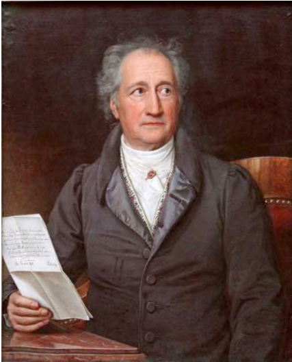
Johann Wolfgang von Goethe um 1828

Um 1770 entsteht in Deutschland mit dem „Sturm und Drang“ eine Bewegung junger Schriftsteller, die sich als Gegenpol zur vernunft- und verstandesbetonten Aufklärung versteht. Diese neuen Literaten stellen das Gefühl und die grenzenlose Selbstentfaltung des Einzelnen in den Mittelpunkt. Die wichtigsten Vertreter dieser kurz dauernden Bewegung sind Johann Wolfgang Goethe und Friedrich Schiller. Mit ihren frühen Dramen wie Goethes „Götz von Berlichingen“ und Schillers „Die Räuber“ und „Kabale und Liebe“ protestierten sie leidenschaftlich gegen die herrschende Ordnung. Goethes Briefroman „Die Leiden des jungen Werther“ wird als Spiegelbild für das Lebensgefühl der jungen Generation zu einem Kultbuch für die damaligen Intellektuellen.