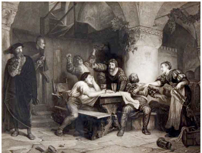
In Auerbachs Keller, Leipzig. (Szene aus dem „Faust“)

Hauslehrer . Der junge Goethe lernte auch Klavier spielen, fechten und reiten. Mit 16 Jahren zog er nach Leipzig, um, dem Wunsch seines Vaters folgend, Rechtswissenschaft zu studieren. Eigentlich hätte er lieber in Göttingen alte Sprachen, Geschichte und Literatur studiert. Öfters als in rechtswissenschaftlichen Vorlesungen zu sitzen, genoss er dann das Studentenleben: „Mein Leipzig lob ich mir! Es ist ein Klein-Paris und bildet seine Leute“ wird später in seinem Werk „Faust“ zu lesen sein. In Leipzig stieß der junge Goethe auf die Motive für den Faust-Stoff. Er setzte mit seiner Dichtung auch dem „Auerbachs Keller“ - einer Lokalität, in der er gern zechte - ein Denkmal.